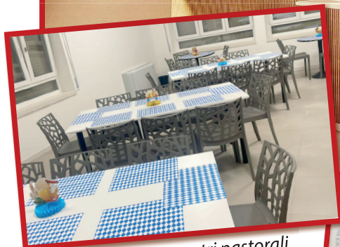
5 nuove sale per incontri pastorali