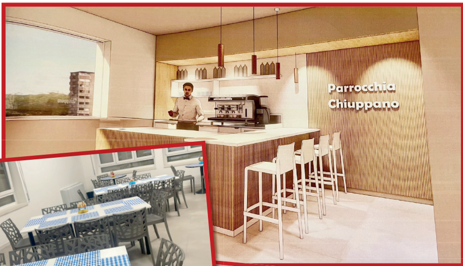
Bar del nuovo Centro Parrocchiale