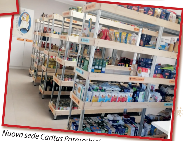
Nuova sede Caritas Parrocchiale

Un aiuto e un sostegno per la tua Parrocchia!